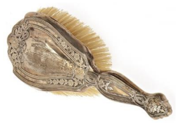
Légendes des artefacts en bas de page.