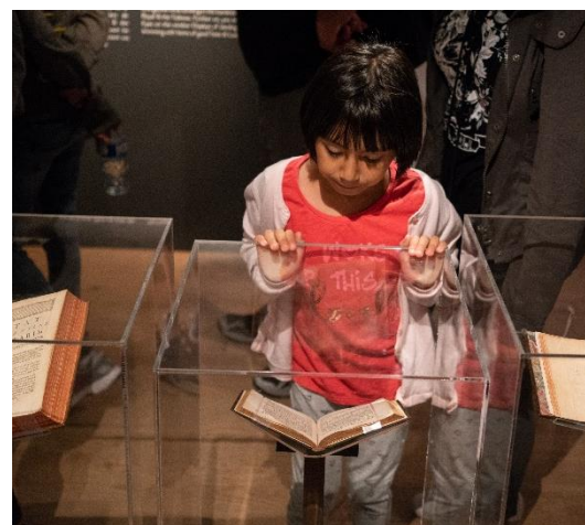
Jeune visiteur dans l'exposition Paris en vitrine