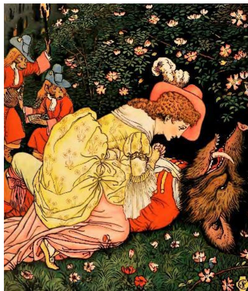
La Belle et La Bête , illustration par Walter Crane, 1874

La programmation des fêtes prévoit également l'heure du conte (11 h et 14 h en français ; 13 h en anglais) et un atelier créatif (en continu) permettant de créer une boule à neige décorative , clin d'œil à l'expérience de réalité virtuelle de l'exposition Il neige à Paris . Les familles auront aussi l'occasion de découvrir l'exposition permanente du Musée, Histoires et Mémoires , grâce à un nouveau guide découverte , conçu pour stimuler la connaissance autour des objets de la collection et les discussions entre parents et enfants.