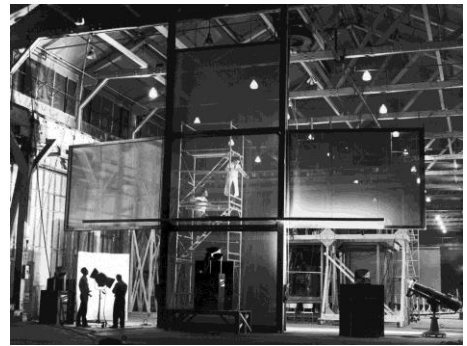
Écran en forme de croix, pavillon Labyrinthe

Pour une première année, le Musée ouvrira ses portes en soirée les mercredis 19 et 26 juillet à l'occasion de L'International des Feux Loto-Québec présenté à La Ronde. Les visiteurs pourront ainsi profiter des