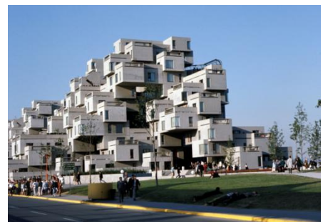
Habitat 67

Inspirée par les innovations technologiques et les grands rêves concrétisés durant l'exposition universelle de 1967, cette exposition s'articule en six zones thématiques (Rêver l'Expo, Rêver la ville, Le cauchemar de la guerre froide, Rêver l'être humain, Rêver la terre et Rêver de l'Expo). Ces thèmes célèbrent la vision grandiose et utopique de cet événement, l'envergure du projet phare d'Habitat 67, ainsi que les prouesses technologiques comme celles développées par l'ONF, précurseur de nombreuses avancées audiovisuelles comme en témoigne son pavillon Labyrinthe , l'une des grandes attractions d'Expo 67.