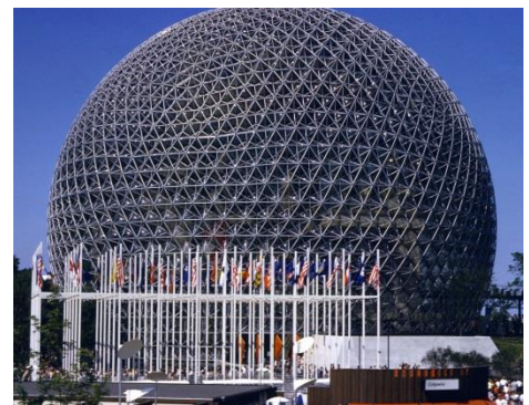
Pavillon des États-Unis