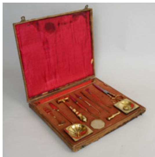
Nécessaire d'écriture, Italie, 17 e siècle, 1983.35.1-14