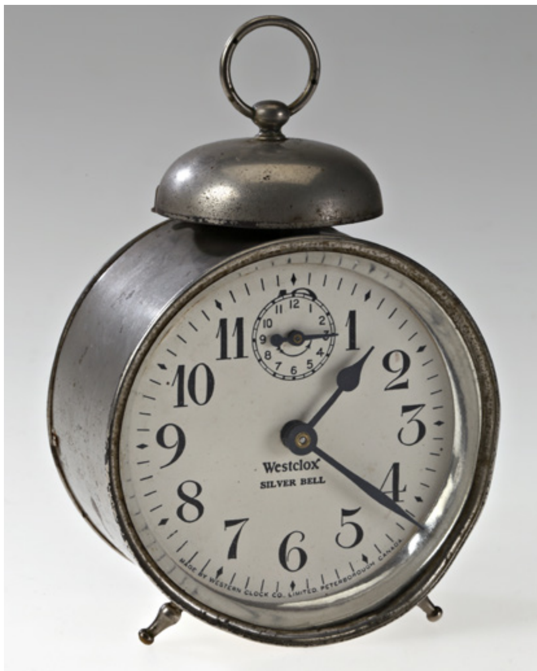
Réveille-matin Westclox, Western Clock Co., Canada, vers 1910. M2004.159.1

L'entreprise américaine Western Clock remporte beaucoup de succès avec la mise en marché de son nouveau réveille-matin, le Big Ben. Son nom, facile à retenir, s'inspire de la fameuse tour de l'horloge du palais de Westminster à Londres. Les consommateurs sont séduits par cette nouveauté : on en vend plus de 28 000 lors de la première année de production, en 1909. Devant la forte demande, l'entreprise ouvre, au cours de 1920, une usine à Peterborough, en Ontario. Depuis, cet appareil iconique a brusqué bien des réveils.