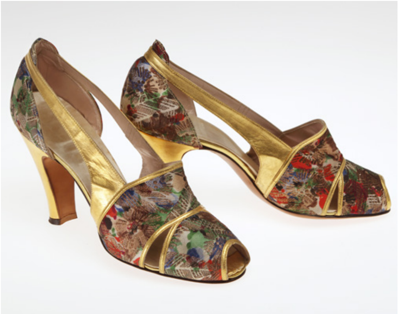
Sandales de soirée, vers 1936. M974.19.51.1-2

Dans les années 1920 et 1930, on appelle « sandales de soirée » des chaussures avec courroies qui laissent à découvert une partie du pied. Quand les modèles évoluent pour montrer les orteils, les ongles peints deviennent à la mode.